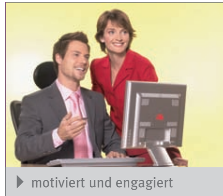
► motiviert und engagiert

Die Kombination aus Arbeitnehmerüberlassung und anschließender Personalvermittlung bietet Ihnen eine hohe Sicherheit bei der Auswahl zukünftiger Mitarbeiter, da Sie „on the job“ die fachlichen und persönlichen Fähigkeiten Ihres neuen Mitarbeiters durch den Zeitarbeitseinsatz erleben. Diese Form der Zusammenarbeit hat sich in der Praxis besonders bewährt ▲