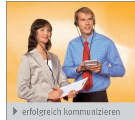
► erfolgreich kommunizieren

JOBS'n'CALLS unterstützt durch die Überlassung qualifizierter Mitarbeiter die Kommunikation Ihres Unternehmens mit Ihren Kunden um ein Vielfaches.