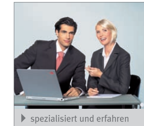
► spezialisiert und erfahren

Neben unseren Niederlassungen haben wir Dépendancen in vielen großen Städten Deutschlands. Die Consultants von JobsForFinance überlassen Ihnen z.B. kurzfristig verfügbare, qualifizierte und erfahrene Buchhalter und Controller. Englischkenntnisse und SAP-R/3-Erfahrung sind selbstverständlich bei unseren Servicemitarbeitern.